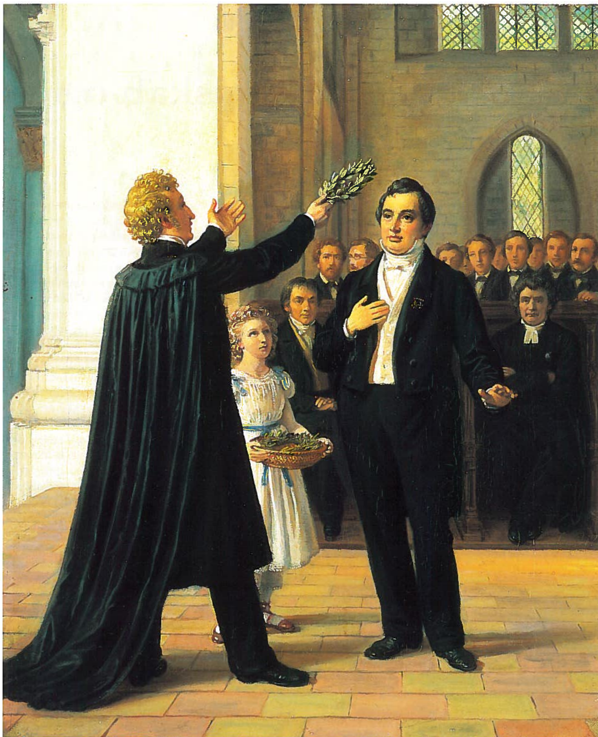
Studenter og literater arbejdede for at forene de skandinaviske folk og udsone fortidens stridigheder mellem danskere og svenskere. I 1829 kronede den svenske digter Esaias Tegnér i Lunds Domkirke Adam Oehenschläger som Nordens digterkonge.

heden om, at de tre skandinaviske lande var ét broderfolk, nært beslægtet i sprog og kultur. Vel vidende, at Danmark kun var et lille land, søgte man efter en alliance, der kunne stå mål med truslen fra et forenet Tyskland. De såkaldte skandinavister betragtede de nordiske folk som grene på samme folkestamme og ønskede et forenet Norden. De syntes helt at glemme, at det ikke var særlig længe siden, at Dan-