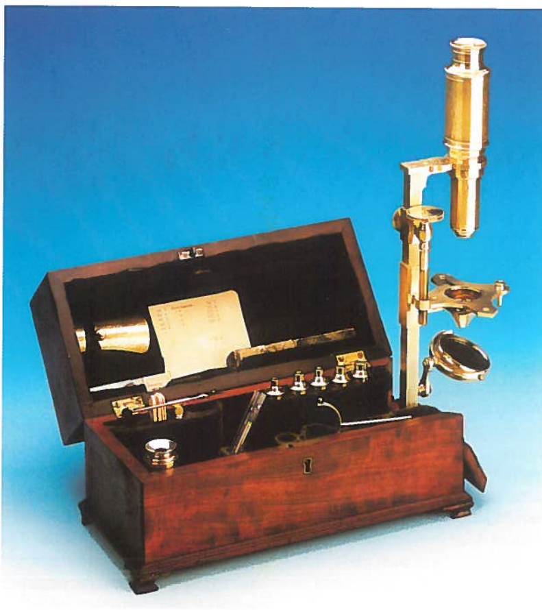
Rejsemikroskop som botanikerne kunne tage med sig på deres videnskabelige færd ud i det grønne.

løbende med sin høje post, der blandt andet indbefattede at være direktør for Det kongelige Teater og Det kongelige Bibliotek, studerede Hauch fysikken og kemien. I 1794 udkom hans Begyndelsesgrunde til Naturlæren , som var den første danske lærebog i fysik. Hauch søgte naturens lovmæssigheder og mente, at de skulle findes gennem systematisk tilegnelse og erfaring. I sin imponerende instrument-samling – hans Physiske Cabinet – gemte han på en lang række af højst kuriøse og meget fascinerende instrumenter, herunder: En skrue uden ende, en model af James Watts dobbeltvirkende