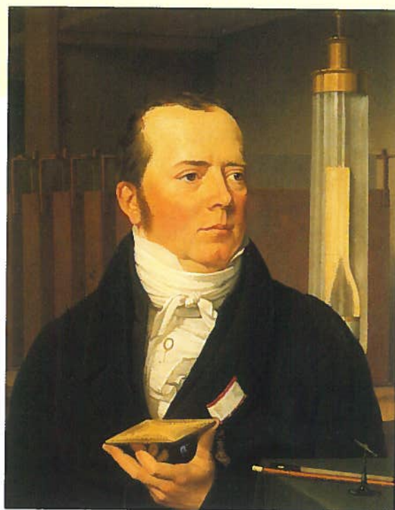
Hans Christian Ørsted

Ørsted er i dag verdensberømt, fordi han i 1820 gjorde den opdagelse, at en elektrisk strøm i en ledning påvirker en magnet, så den slår ud. Elektromagnetismen blev sammen med englænderen Michael Faradays senere opdagelse af induktionen grundlaget for at kunne fremstille elektricitet. For Ørsted selv var opdagelsen af elektromagnetismen ikke kun af naturvidenskabelig betydning. For ham var denne opdagelse samtidig en bekræftelse af, at der var en overordnet plan med tilværelsen – en overordnet intelligens. Han kaldte naturlovene for Guds tanker. Naturen var for ham ikke noget dødt og mekanisk. Naturen var besjælet. Da Ørsted i sine sidste år skrev sit hovedværk, kaldte han det Ånden i naturen . I dette opsummerede han de tanker, han havde gjort sig gennem årene, og som havde haft umådelig betydning for guldalderens åndsliv. Ørsted var nemlig ikke kun fysiker eller naturvidenskabsmand, men også naturfilosof inspireret af Kants og Fichtes teorier. Samtidig var han digter og skrev poesi og prosa. Han arbejdede aktivt med det danske sprogs fornyelse og opfandt selv henved 2000 danske ord. Ørsted var også den første, for hvem det i 1825 lykkedes at finde det me-