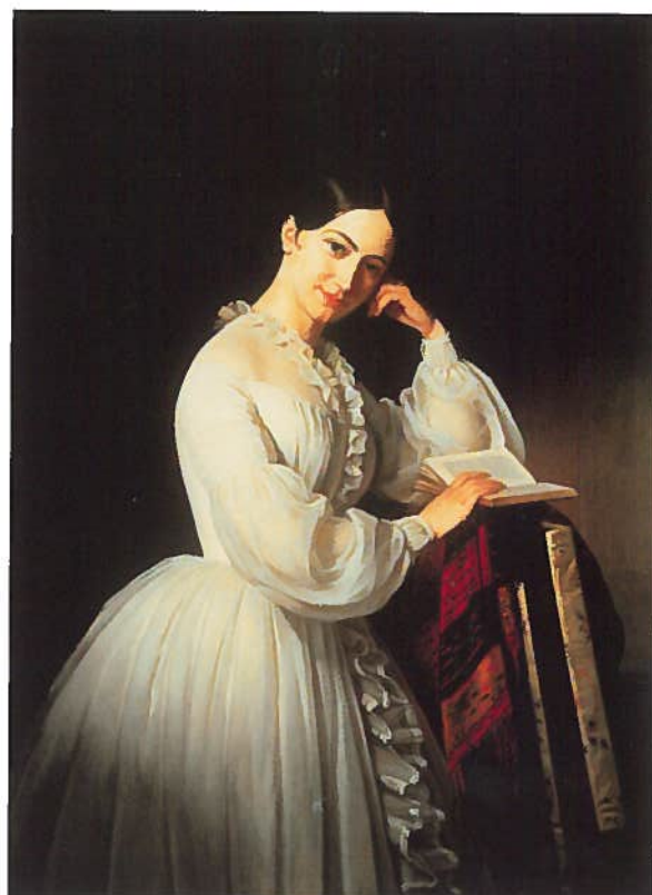
Skuespillerinden Johanne Louise Heiberg

Romantikernes behov for at opleve det hele menneske med alle dets forskellige stemninger og følelser kunne bedst tilfredsstilles ved at opsøge naturen. Der-