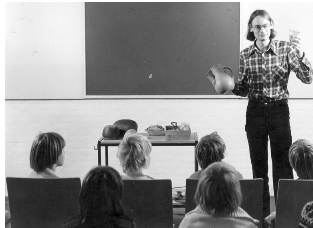
↑ Undervisning med kopigenstande på Vikingskibsmuseet ca. 1977.

Da det nyåbnede Zoologiske Museum i 1970 indgik samarbejde med Københavns Kommune, banede det vejen for en pædagogisk faglighed på museerne – og efterfølgende etablering af Skoletjenesten. Snart fulgte flere kommuner og museer, bl.a. Nationalmuseet. Samarbejderne indebar blandt andet, at lærere fra skoleforvaltningerne var med til at udforme undervisningsmaterialer og påvirke, hvad eleverne skulle lave på museerne. Men åbningen mod skoleverdenen foregik