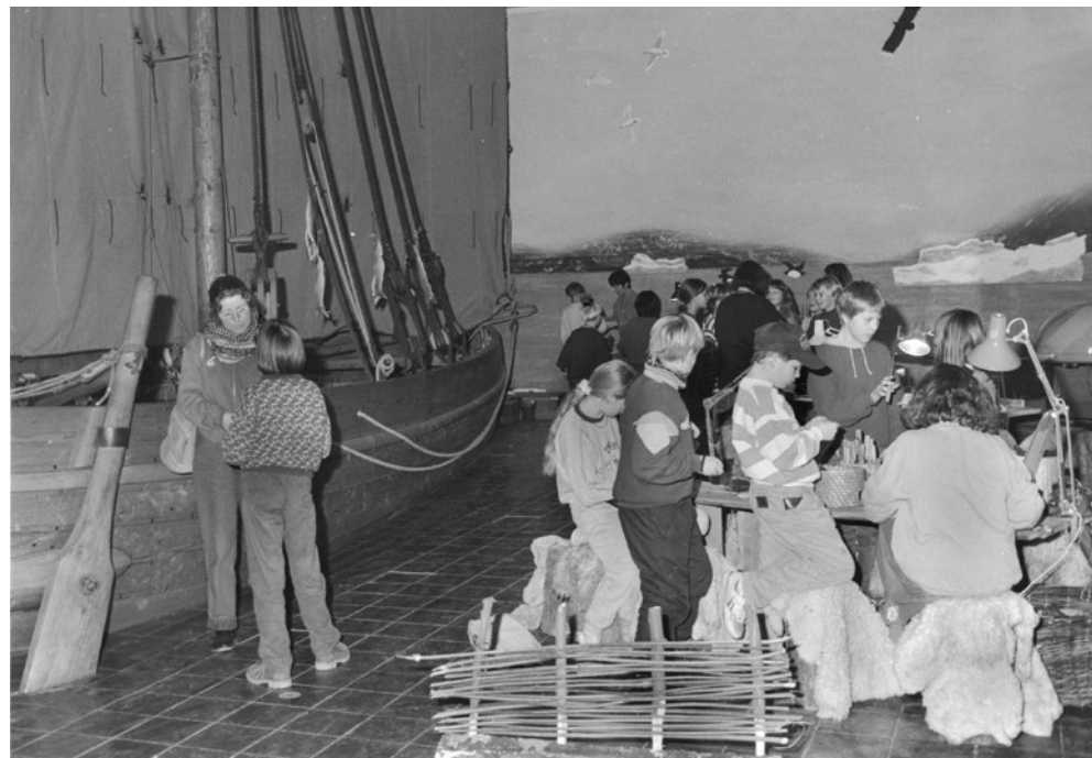
← Vikingeskibsmuseet var med, da Skoletjenestens formelt blev stiftet i 1976. I 1979 besøgte 17.974 elever museet, hvilket udgjorde 12% af det samlede besøgstal.