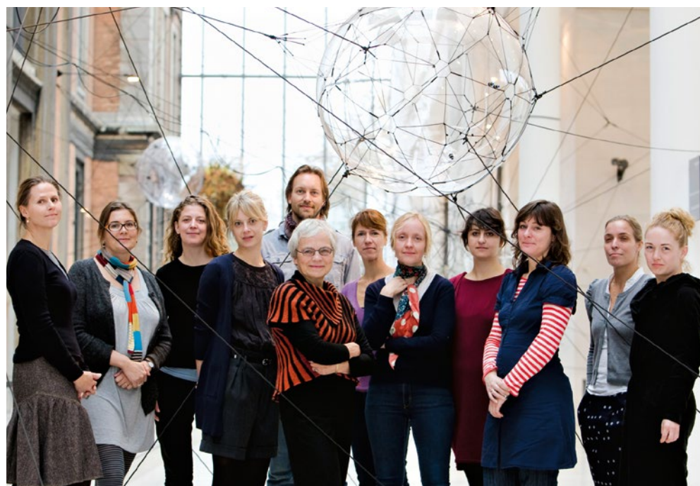
← Projektgruppen bag udviklingsprojektet "Museer som rum for medborgerskab", der satte kernebegreber fra undervisningsverden i spil i en større museumsfaglig kontekst og resulterede i bogen "Dialogbaseret undervisning".

ikke uden sværdslag på museerne. "På Nationalmuseet kæmpede vi mod en gruppe af ældre konferensstuderende, som mente, at omvisninger var den eneste måde at formidle det faglige stof på. De mente ikke, at det var fagligt forsvarligt at overlade formidlingen til skolefolk," fortæller Vestergaard.