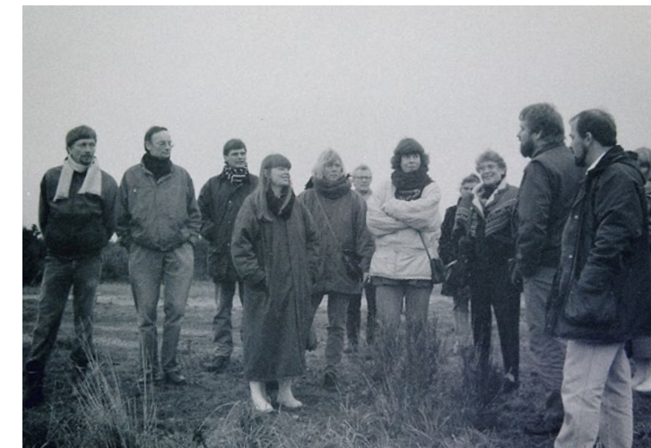
↑ Skoletjenesten på erfaringsudveksling hos Skoletjenesten Esbjerg Kommune på Myrthuegård i begyndelsen af 90'erne.

Mere end 40 år efter Skoletjenesten blev etableret, anvendes modellen med medarbejdere, der har daglig arbejdsplads på museerne og pædagogisk netværk på tværs, stadig, men rammerne er helt anderledes end tidligere. Entreprenørmo-