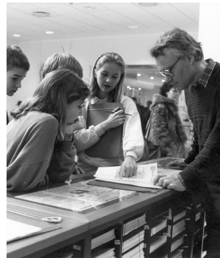
→ Elevernes iagttagelse som basis for refleksion var et af Skoletjenestens pædagogiske greb. Arbejds- og opgaveark fungerede som redskab til at støtte elevernes iagttagelser. Her på Danmarks Akvarium.