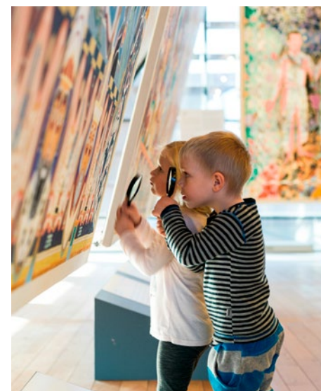
↑ Det er indsamling og omsætning af erfaringer fra det pædagogiske udviklingsarbejde, der er fokus for Skoletjenestens arbejde i disse år. Her i gobelinsalen på KØS.