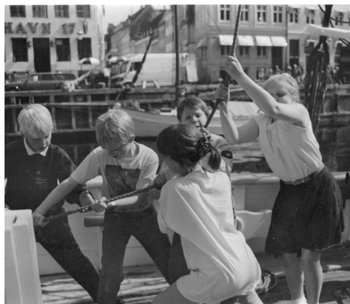
↑ Aktivering af eleverne med praktiske gøremål var et af de nye pædagogiske greb. Her på galeasen "Anna Møller" i Nyhavn.