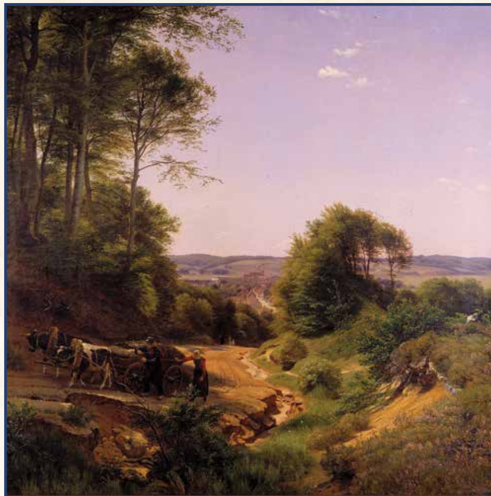
P.C. Skovgaard: Udsigt over Vejle, 1852. Olie på lærred. Vejle Kunstmuseum.