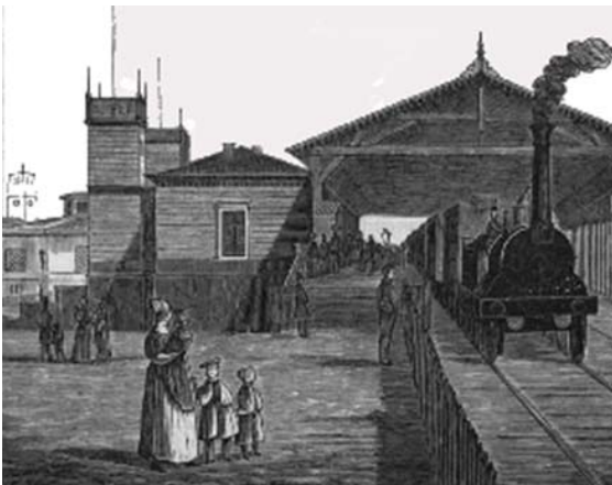
Københavns 1. jernbane, 1848