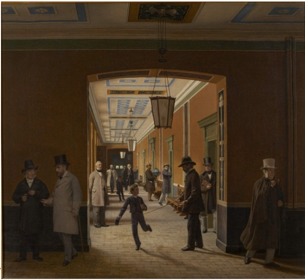
Christen Dalsgaard: Stengangen på Sorø Akademi med portrætfigurer , 1871.