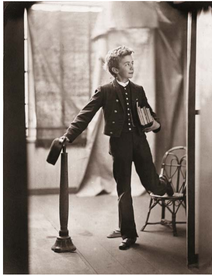
Elev fra Sorø Akademi