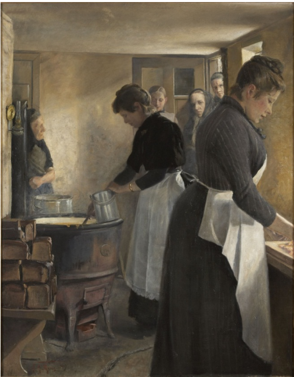
L.A. Ring: Maduddeling på Frederiksberg . 1887