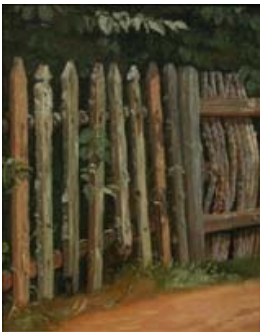
Christen Dalsgaard: Ved Havegærdet , 1850

I dag fremhæver flere kunstkritikere det interessante ved Christen Dalsgaards små men omhyggeligt udførte olieskitser og detaljestudier fra omkring 1850'erne. Man kan kun gisne om, hvorvidt han selv opfattede disse close-ups som et nødvendigt onde (og derfor med begejstring hilste fotografiet velkomment som et tidsbesparende hjælpemiddel) eller om han brugte skitserne på en mere eksperimenterende og selvudviklende måde. I dag tildeles de opmærksomhed, fordi de er et eksempel på en mere moderne, tilfældig og dristig beskæring af detaljer og fragmenter. I dag finder vi en tilfældig og skæv komposition i den såkaldte snapshotæstetik, der er almindelig hos mange nyere kunstfotografer.