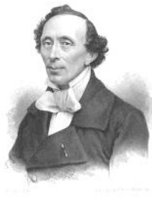
H. C. Andersen (1805-1875) skriver i 1842 En digters bazar , stærkt inspireret i både form og indhold af sin første togtur.