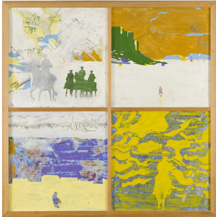
Per Kirkeby: Den langløbede Colt . 1966