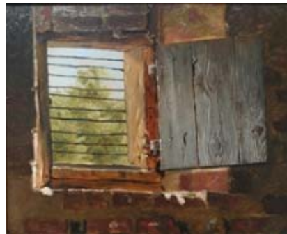
Christen Dalsgaard: Studie fra et udhus , 1850