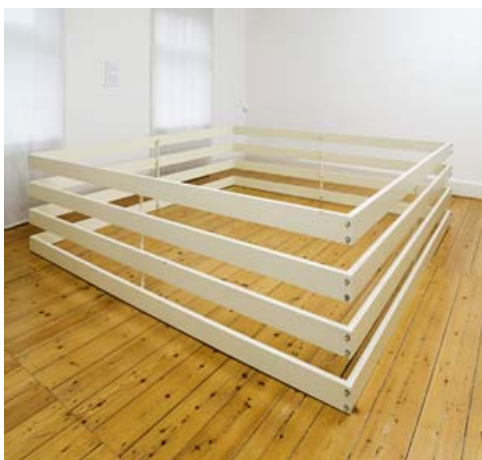
Mogens Møller: 4 kvadratiske rammer. 1966.