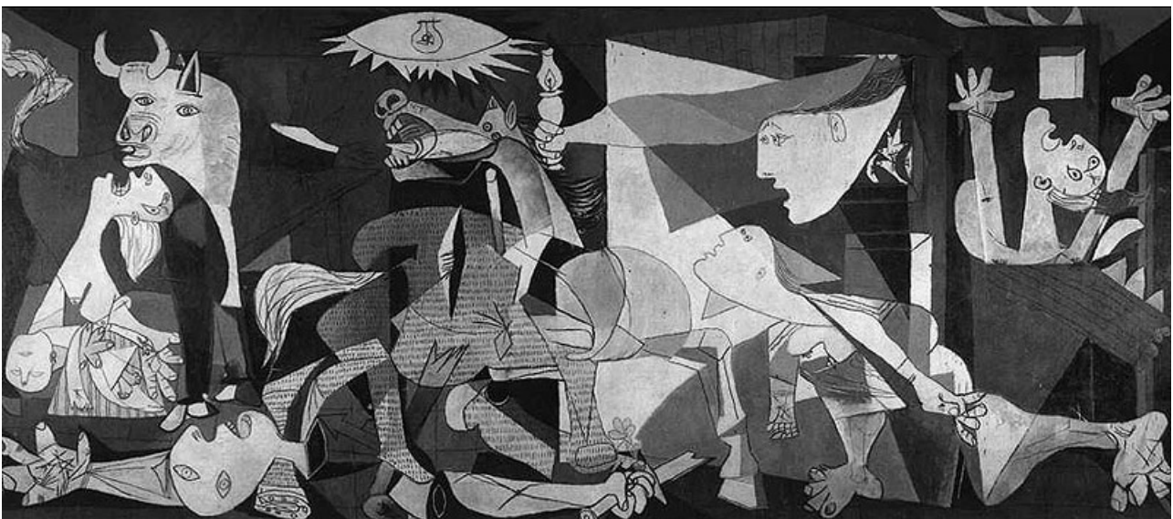
Pablo Picassos Guernica