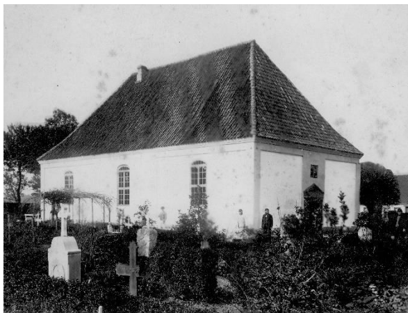
Den reformerte kirke, ca. 1920.

De reformerte var en anden form for kristne end katolikker og protestanter. Mange af dem boede i Frankrig. Her blev de forfulgt, og de var derfor flygtet til Tyskland. De var dygtige til at handle og dyrke tobak. Derfor inviterede kongen dem til Fredericia, så de kunne hjælpe byen med at vokse.