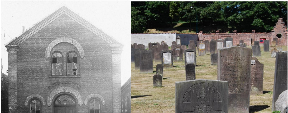
Til venstre: Den jødiske synagoge kort før den blev revet ned i 1914.

Jøderne byggede en synagoge (et bedehus) i Riddergade, og lagde en gravplads ved Vester Voldgade. Synagogen er væk i dag, men gravpladsen kan man stadig besøge.