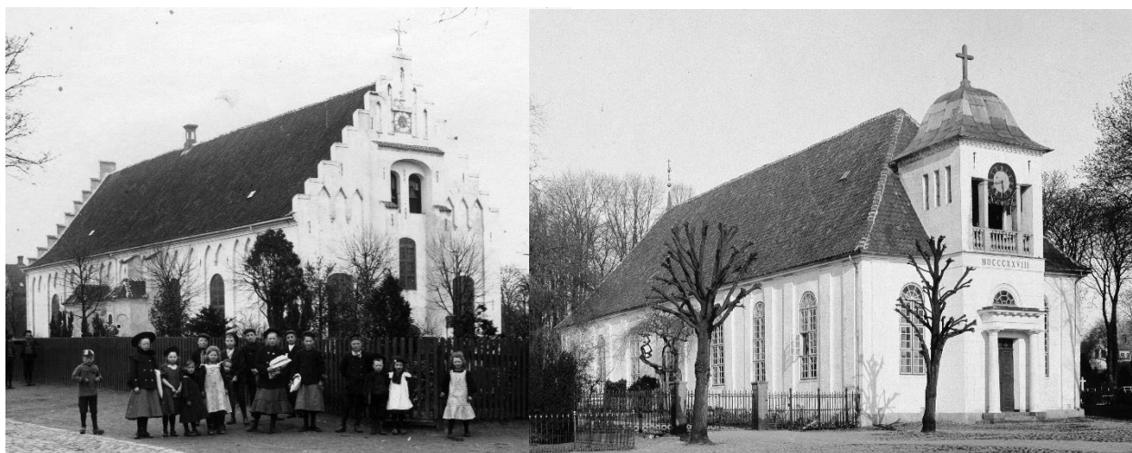
Til venstre: Trinitatis Kirke, ca. 1900.

Michaelis blev mest brugt af byens soldater, og Trinitatis mest af byens borgere. Begge kirker og deres kirkegårde findes stadig i dag. Siden er der bygget flere kirker uden for Fredericias volde.