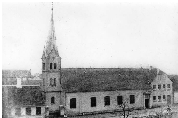
Sankt Knuds Kirke, ca. 1880.

Katolikkerne byggede Sankt Knuds kirke og skole i Sjællandsgade. De findes i dag, men kirkegården er væk.