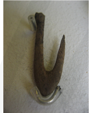
Fiskekrog fra stenalderen lavet af en knogle

Stenalderfolket i Vedbæk levede som jægere, fiskere og samlere. De havde ingen marker. De måtte skaffe sig al mad fra naturen. De boede tæt på havet og skoven. Her kunne de skaffe sig mad og ting til våben og redskaber. De kunne sejle ud på havjagt og skyde sæler med harpuner. De kunne fange mange forskellige slags fisk - fisk, som vi også kan fange og spise i dag. Deres både var lavet af udhulede træstammer og kaldes for stammebåde. I stammebådene kunne de sejle ud til øen Ven, som du måske kan se et stykke ude. Her kunne de gå på jagt efter sæler. Eller de kunne sejle helt til den anden side af Øresund og besøge andre stenalderfolk eller gå på jagt efter urokse, bjørn eller elg. Disse dyr var udryddet på Sjælland for 7.000 år siden. Når stenalderfolket skulle fiske, brugte de fangstredskaber som fiskespyd og fiskekroge. Sand fra stranden kunne de bruge, hvis de skulle slibe spidsen på fiskespyddet, som var lavet af en knogle.