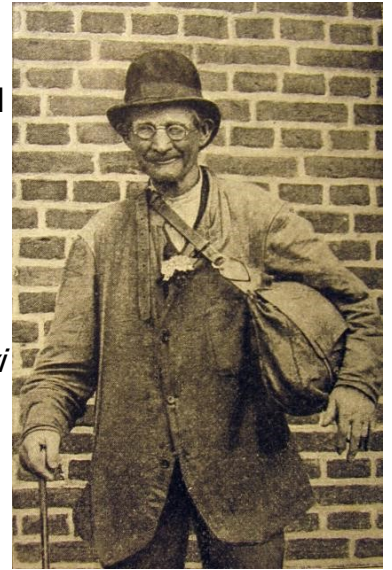
Klog mand fra Midtjylland. Ca. 1900

"Vi havde en datter, der havde fået grøde på hendes ene skulder, og vi søgte fire doktorer, men de kunne ikke sætte den væk. Så rejste a de 26 mil op til Vindblæs til den kloge kone der. Der var så mange ved hende, te a lå der i to dage, inden a kunde få hende i tale. Den anden dag, da a fik snak med hende, sagde hun: "Nu ka a ikke holde det ud længere i dag, men da du er kommen så langt henne fra, skal du blive den første i morgen". Hun spurgte om pigen var med, "Nej." – "Ja, det kan også være det samme, men er hun med, kan a jo sagt se hende."