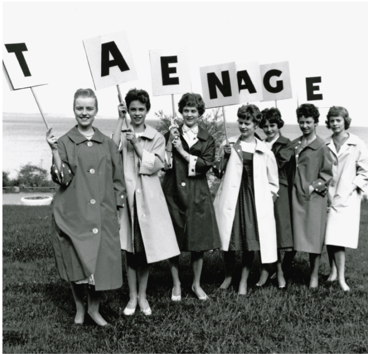
Stop slaveri! (2017-2018)