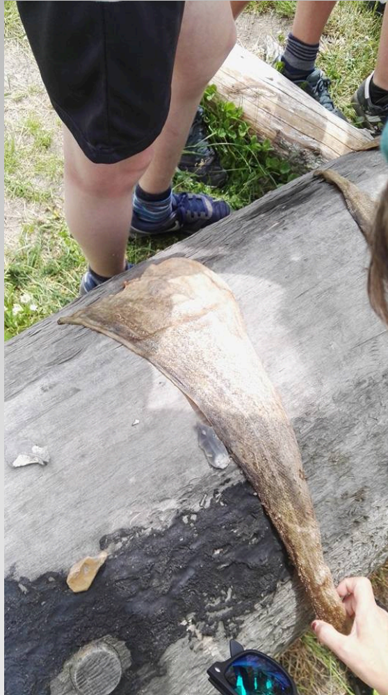
Temadag i skoletjenesten 28.marts 2017