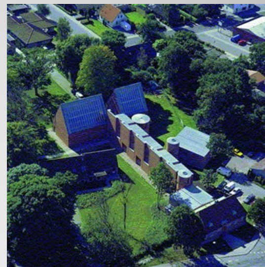
Temadag i skoletjenesten 28.marts 2017