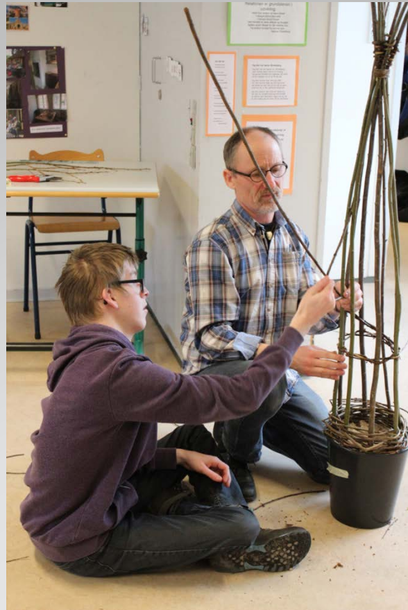
Temadag i skoletjenesten 28.marts 2017