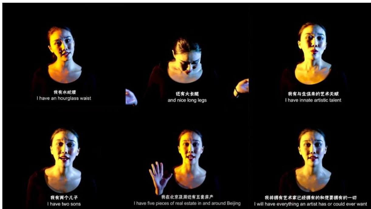
Cao Yu, I have , 2017 HD-video, 4:22 min © Cao Yu