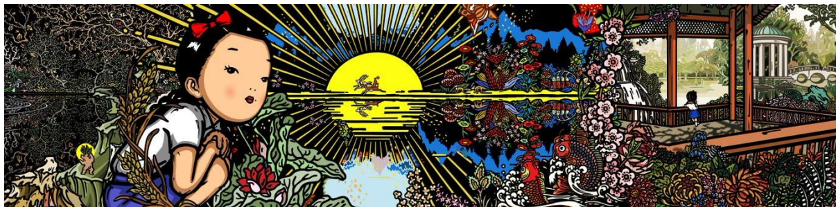
Bu Hua, The Light of Love , 2019 Digital print on canvas, 14.5 x 2.45 m © Bu Hua