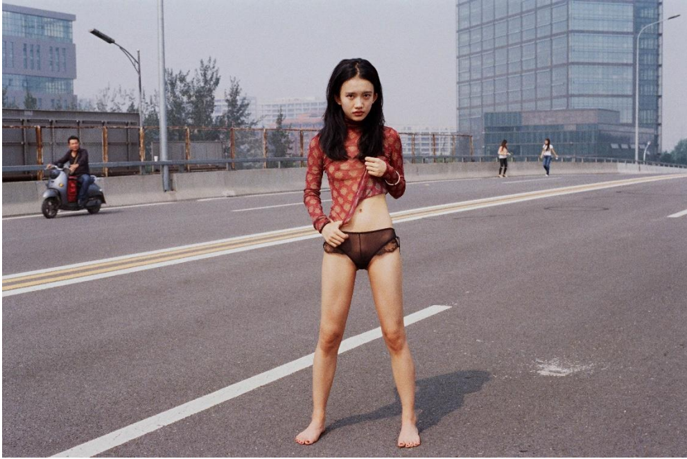
Luo Yang, Girls , 2008-16, Chromogenic print 70 x 100 cm © Luo Yang