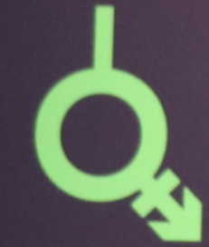
Androgyne and Neutrois