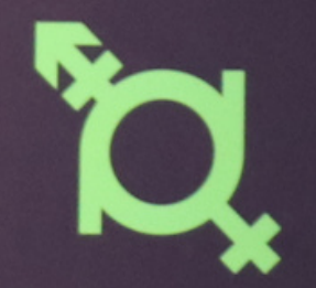
Androgyne and Female