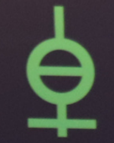
Agender Version 2