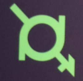
Intergender and Neutrois