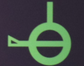
Demiagender with Thirdgender