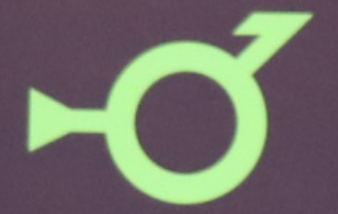
Thirdgender and Demiboy