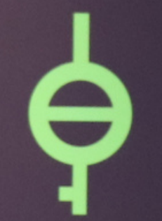
Demiagender with girl