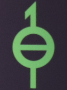
Demiagender with boy