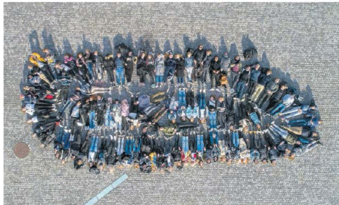
Elever ligger som slaverne gjorde det i de gamle slaveskibe. Alle medvirkende på dette billede har givet tilsagn om optagelse med drone hængende direkte over dem.