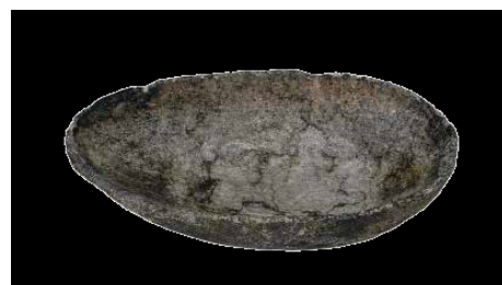
Thulefolkets lampe, 1200-1900 e.v.t.