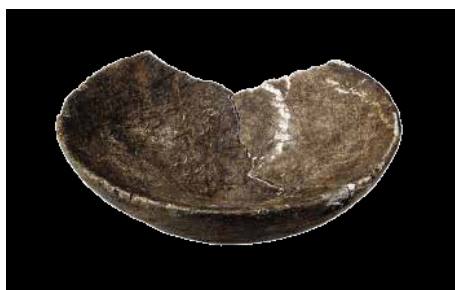
Saqqaqfolkets lampe, 1500-800 f.v.t.

Om vinteren er der mørkt og koldt i Grønland. Fedtstenslampen har derfor haft stor betydning for livet i boligerne i mere end 3.000 år.