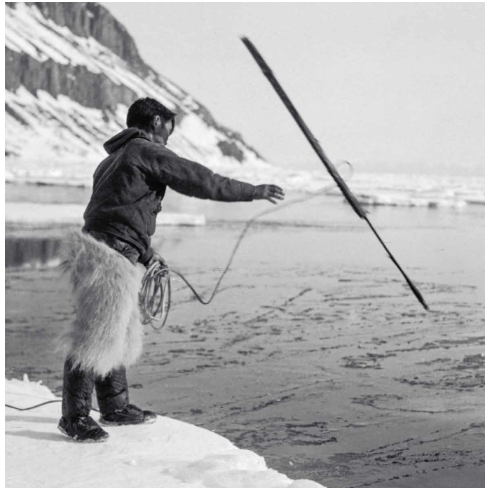
Harpunering fra iskanten, Iterlassuaq ved Thule, 1947

Harpunspidserne er udviklet gennem tiderne, men fælles for dem er den karakteristiske spidse form. I mere end 3.000 år har man fanget havpattedyr med harpuner.