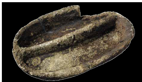
Dorsetfolkets lampe, 800 f.v.t. - 1350 e.v.t.