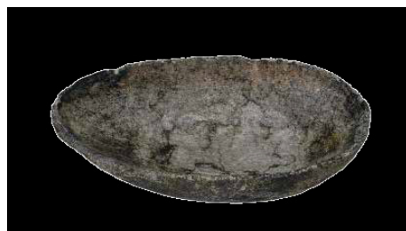
Thulefolkets lampe, 1200-1900 e.v.t.