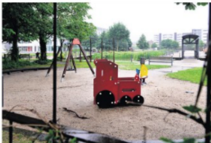
Det er ikke muligt for politiet at flytte misbrugere ud af Byparken, med mindre de har lovet noget ulovligt.

- Vi kan jo ikke vide, om det er dem, der har smidt spejlen på jorden. Vi er nødt til at opdage det i gerningsøjeblikket, før vi kan jo ikke smide folk væk fra en bænk i par-