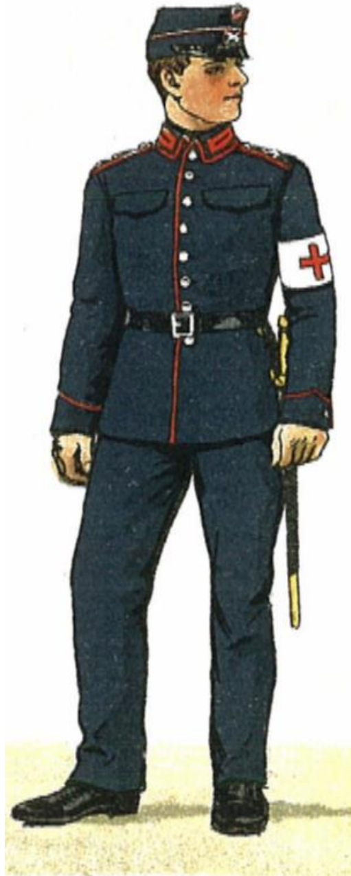
Menig af Sundhedstropperne alm. Tjenestedragt