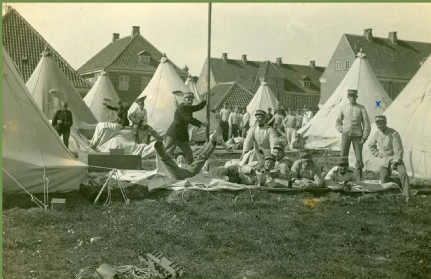
Billede 3: Soldaternes hverdag på Vestvolden