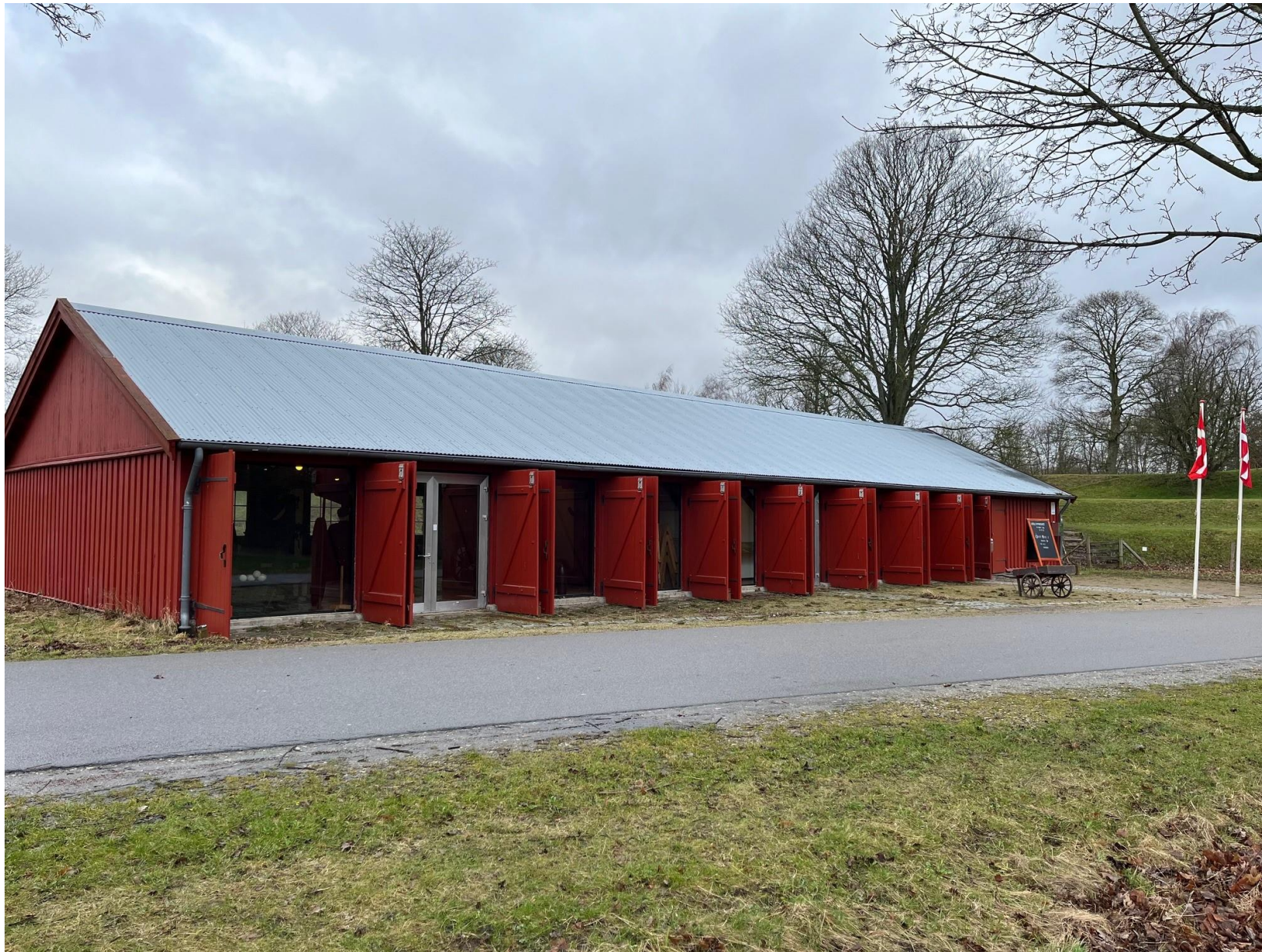
Billede 1: Batteritogsmagasinet