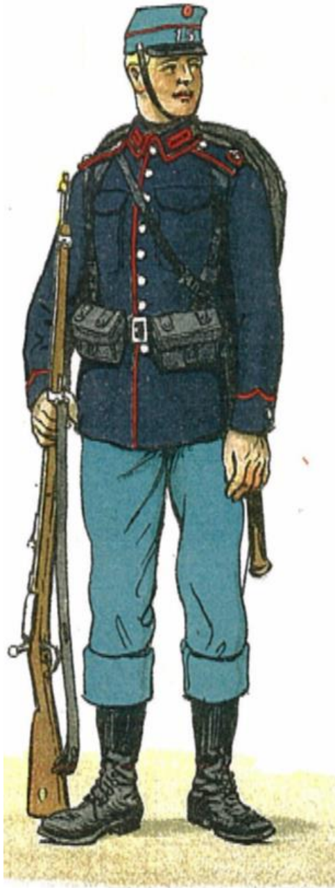
Menig af Fodfolksregimenterne Feldragt