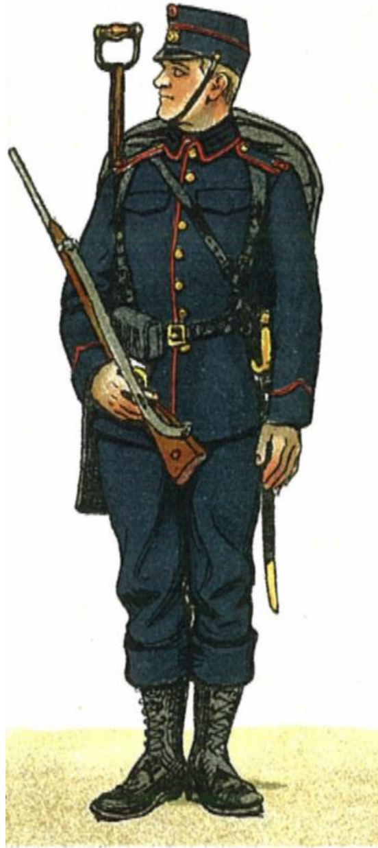
Menig af Ingeniørregimentet Feldragt