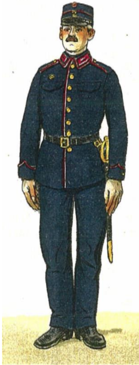
Konstabel af Feltartilleriet alm. Tjenestedragt